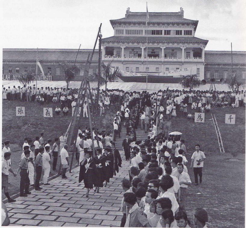
Nanyang University's first Convocation Day for graduates, on 2 April 1960.