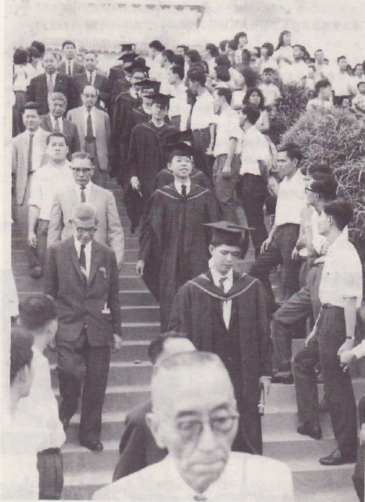
1964年，南洋大学第四届毕业典礼