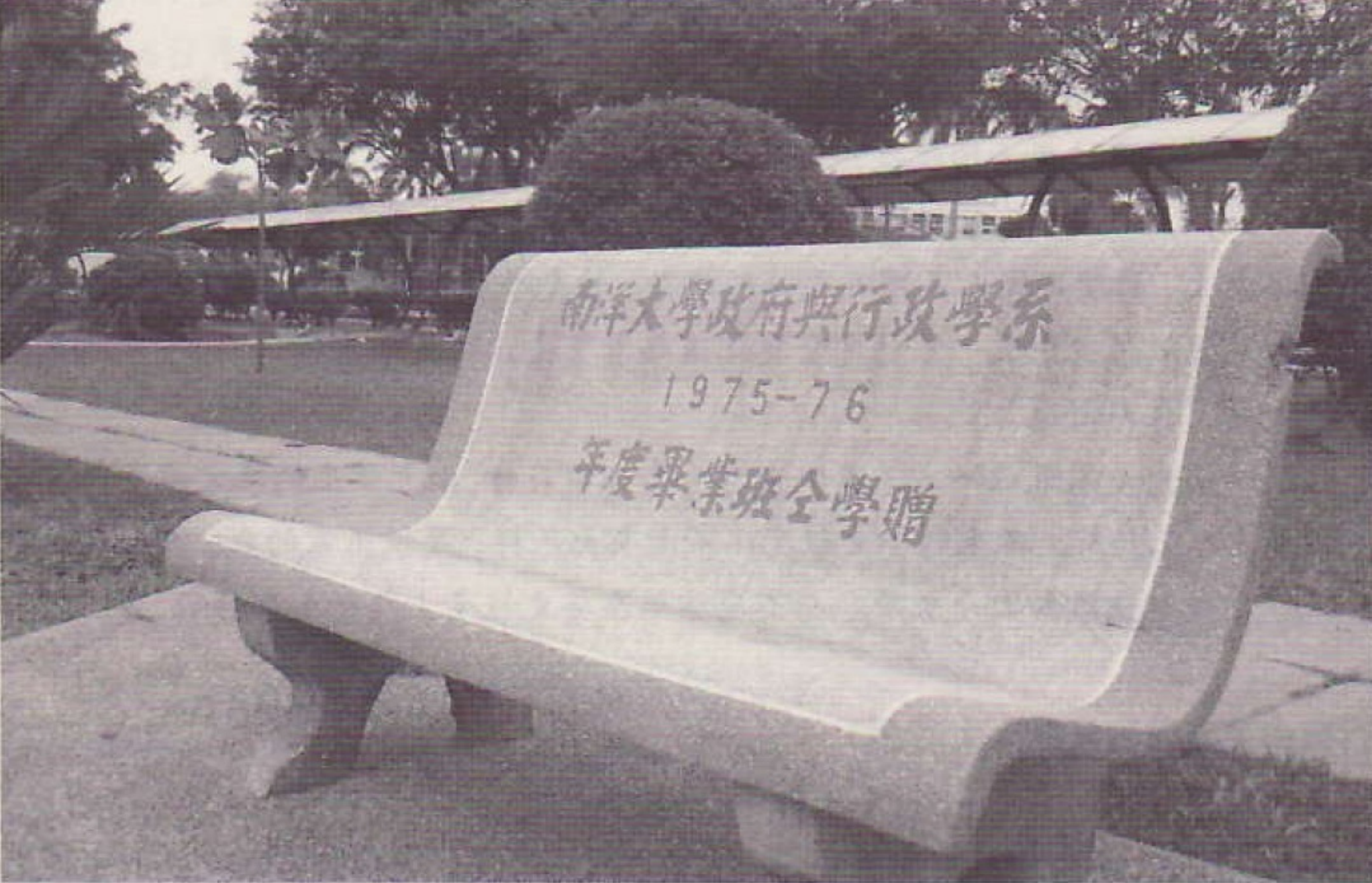
南大湖边毕业生捐赠石椅