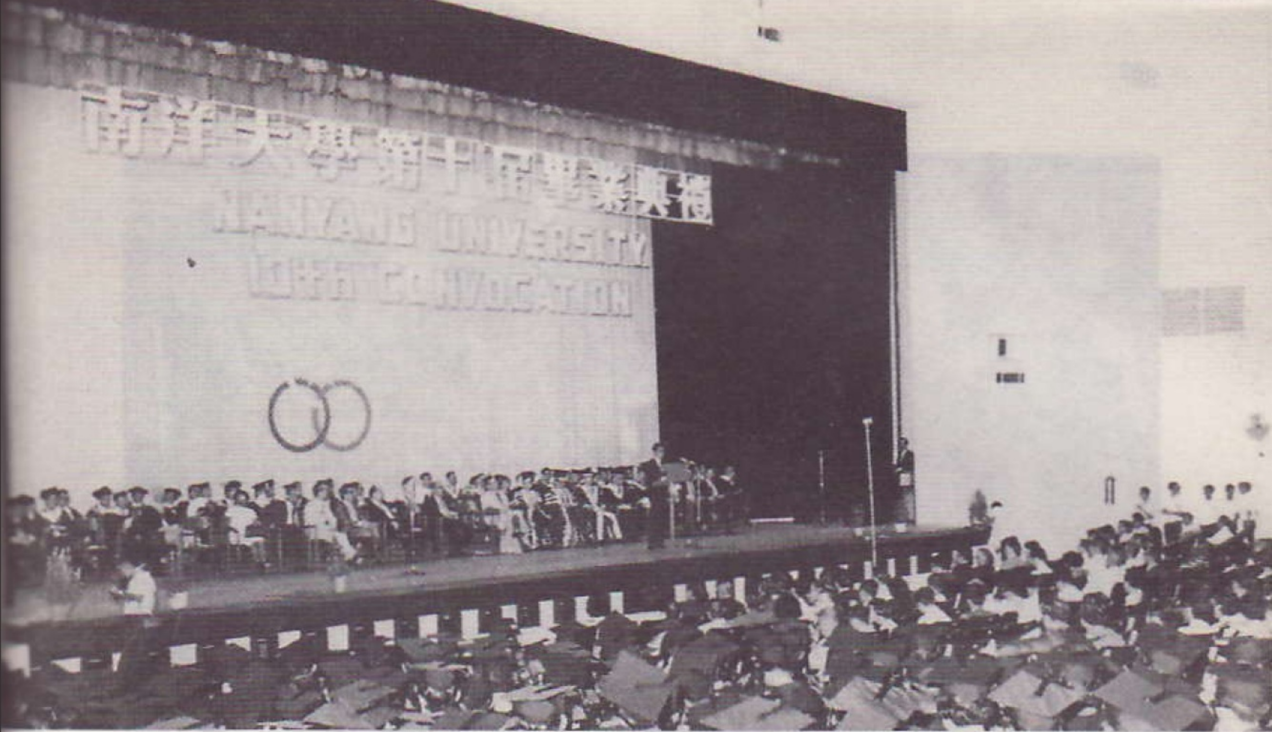
1969年5月24日，南大舉行第十屆畢業典禮