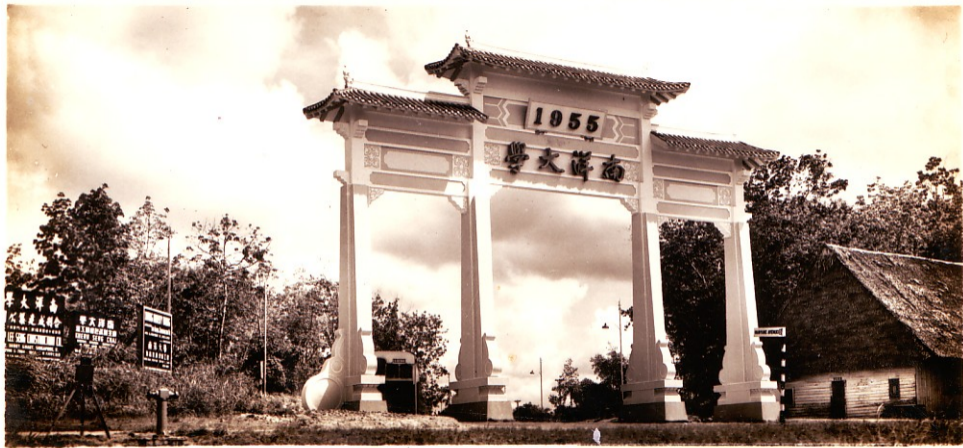
Front Entrance of Nanyang University. 南洋大學校門