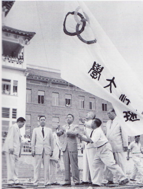
Nanyang University marked the start of its first academic year in March 1956 with a flag-raising ceremony led by millionaire founder Tan Lark Sye (third from left).