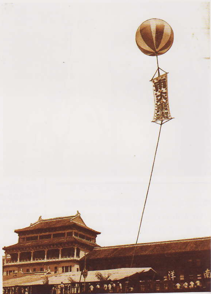
南大校舍落成典礼上，大气球高挂着“南大万岁”在空中傲然顾盼。