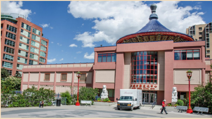
Le centre culturel chinois

proche de chez elle. Cependant, une tradition forte et un marché en expansion avec la Chine rendent le Quartier chinois plus fort. En 2012, la fondation Oi Kwan termina la construction d'un immeuble de seize étages, ajoutant plus de logements pour les personnes âgées du Quartier chinois. A cette même période, la popularité et diversité des restaurants du Quartier chinois augmenta. Beaucoup d'entre eux servent les hommes d'affaires qui travaillent avec la Chine hors des bureaux situés dans le Quartier et la demande d'organisation de grands événements liés aux week-ends de célébration est de plus en plus forte. La pression pour plus de services amena l'expansion du Quartier chinois nord de la rue Centre vers la 16e avenue qui appartenait déjà, en 1999, aux Sino-canadiens à hauteur de 60%. Les commerces du Quartier chinois ont souffert à la suite des inondations de 2013 et on dû faire face à de nombreux défis dans leurs efforts de rétablissement. Après leur réhabilitation, les Quartiers chinois de Victoria et Vancouver ont gardé leurs bâtiments associatifs construits avant la Première Guerre mondiale ainsi que