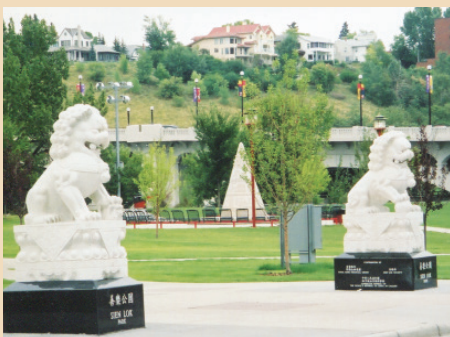
Le parc Sien Lok

bâtiments. Les rues furent embellies et on y installa des réverbères chinois. Dans les années 1990, on acheva les travaux du Centre culturel chinois et du Centre pour personnes âgées du Quartier chinois de Calgary.