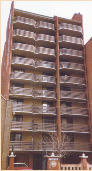
Le place Oi Kwan