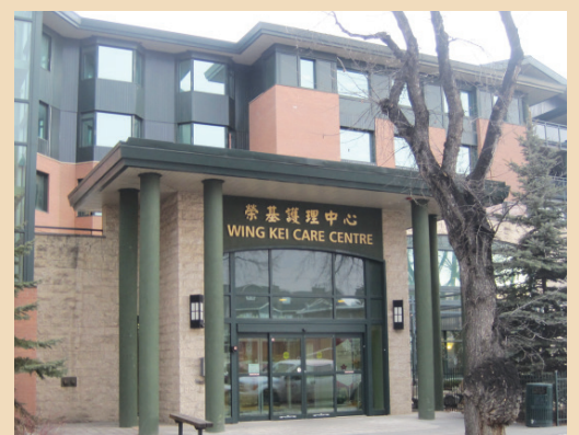
Le centre Wing Kei Care

Le Quartier chinois fait toujours face au défi d'une population chinoise dispersée qui peut souvent satisfaire ses besoins culturels