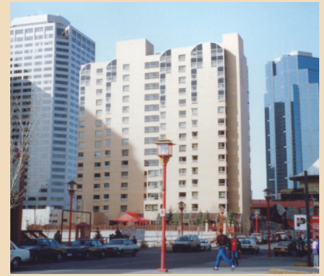
Le développement à forte densité du Quartier chinois

des caractéristiques architecturales datant du début du XXe siècle. C'est pour cette raison qu'ils ont pu être classés dans la catégorie des «Quartiers chinois réhabilités». Au centre-ville de Calgary, au contraire, de nouveaux gratte-ciel furent construits à