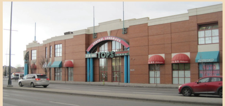
Central Landmark dans le Quartier chinois

l'intérieur et autour du Quartier chinois. Cette réhabilitation amena la disparition de presque tous les bâtiments d'avant-guerre et il ne reste aujourd'hui que quelques traces de l'architecture urbaine du Quartier chinois d'avant-guerre. Par conséquent, le Quartier chinois de Calgary correspond plutôt à un «Quartier chinois remplacé» qu'à un «Quartier chinois réhabilité».